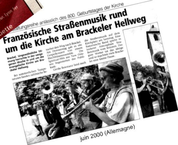
juin 2000 (Allemagne)

1 er janvier 2000 (Ecosse) "they are so ... eclectic" radio ullapool